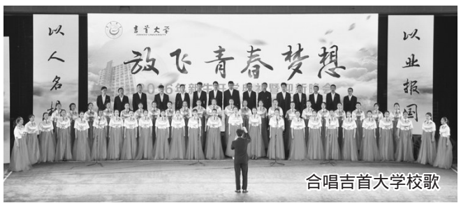
合唱吉首大学校歌

求梦想,用快乐带动心情,用平淡对待磨难,用努力追求幸福,用真诚对待朋友,用感恩对待生活,努力成为全球化经济浪潮中的弄潮儿,用奋斗的汗水书写无悔的人生。选择吉首大学,就是选择了创业的梦想。大学,身体和灵魂总有一个在路上。多看一看与考试无关的好书,多听一些与专业无关的讲座,多参加一些社团活动或志愿活动。