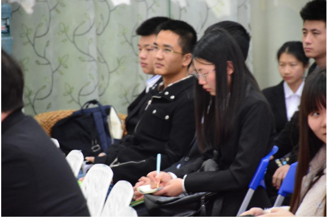
同学们正在认真的做笔记