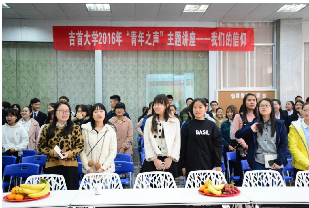
讲座开始前大家集体唱红歌