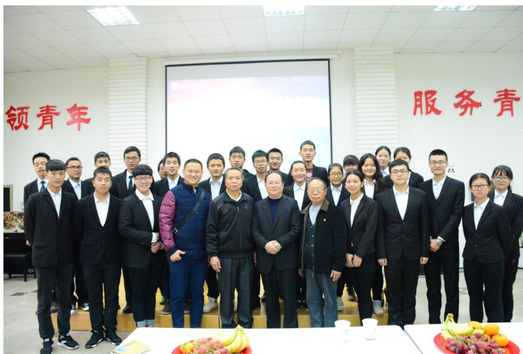
我院工作人员与老师进行了合影