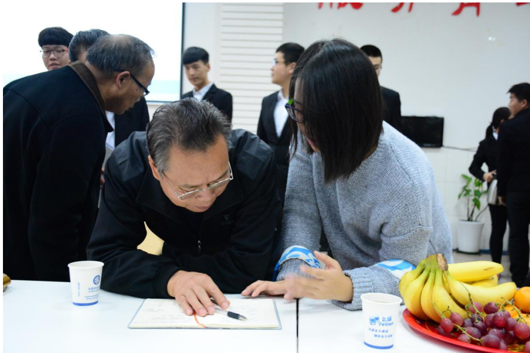
在讲座后同学们积极向老师请教问题