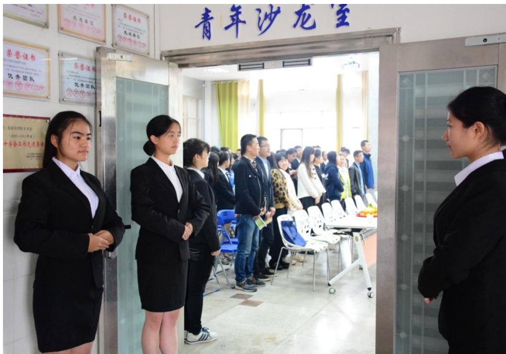
礼仪小姐正在迎听众入场