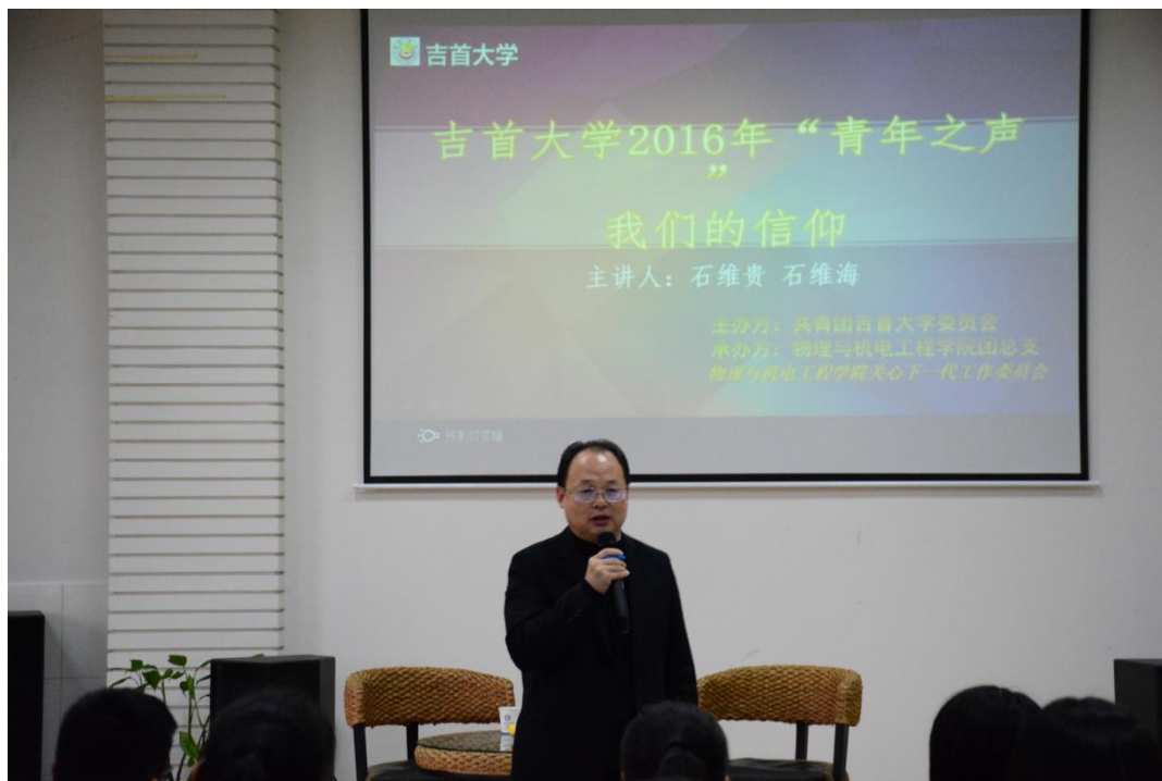
熊书记为讲座做最后的总结发言