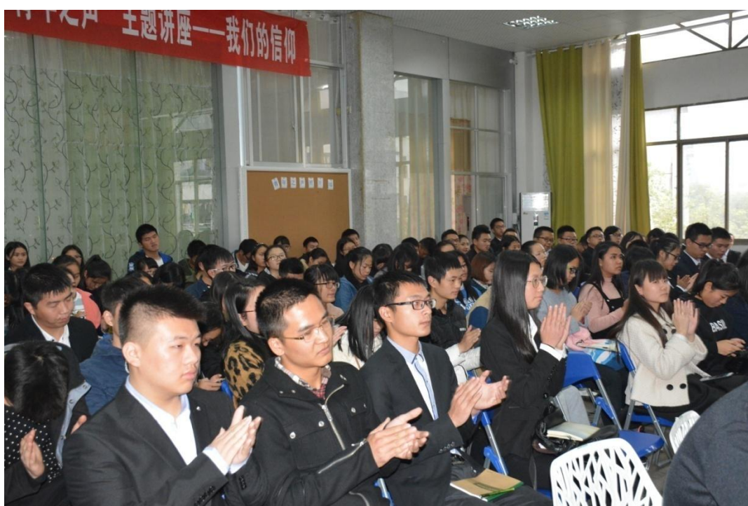
同学们为老师的精彩讲座而鼓掌