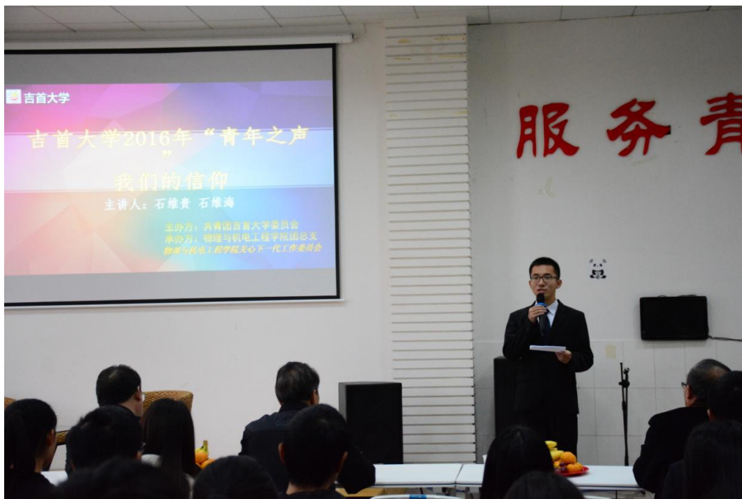
主持人正在做开场白