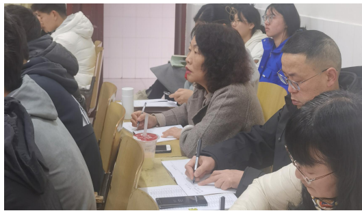
(图为督导听课现场)