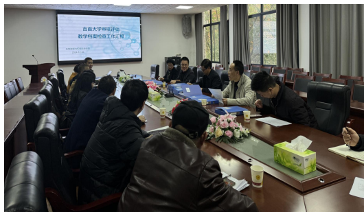
(图为教学档案检查现场)

3. 督改：督导团成员积极开展督改工作，对发现的有关教学问题要对教师个人及相关单位及时反馈。坚持“回头看”，重点关注需要进行整改、完善的部分，及时掌握整改情况。