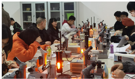
（图为课堂教学现场）

2. 督管：督导团成员积极开展了常规教学随机抽查工作，对课堂教学、各类教学档案等教学建设与教学管理主要环节进行抽查、检查和指导，督促各教学环节达到相应的质量标准。