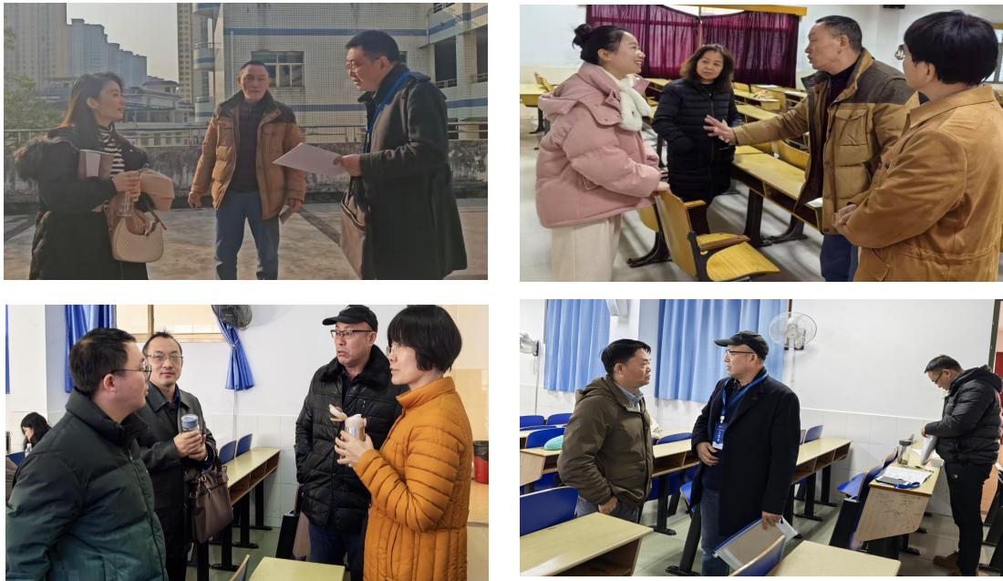
(图为督导与教师沟通现场)