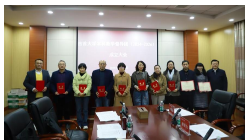
（图为颁发聘书合影）

2024 年第 13 周至第 18 周，全校督导工作紧密结合学校本阶段工作要求，在加大对日常教学情况督查的同时，加强对青年教师和新进教师的指导和帮助。本学期督导工作突出在“督教督学”“督管”“督改”等方面下真功夫，将督导工作落到实处，不走过场，不流于形式。