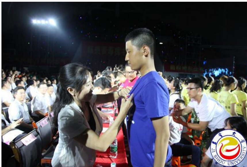
图为校领导为新生代表佩戴校徽

随后，校领导为学生代表佩戴校徽。其余新生自己佩戴校徽。这神圣而庄严的一刻，将永远烙印在全体新生的心中，烙印在吉首大学的精神记忆里。