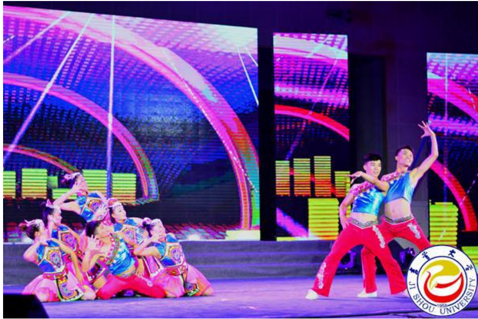
图为民族健身操《民族团结一家亲》表演

整场晚会，内容丰富，精彩纷呈。开场，由音乐舞蹈学院师生表演的民乐合奏《新赛马》，大气磅礴，荡气回肠；学生艺术团舞蹈队表演的《团聚》，体育科学学院健美操队表演的民族健身操《民族团结一家亲》，民族风情浓郁，把我校的民族特色表现得淋漓尽致；学生艺术团曲艺队和新生同台表演的群口相声《多彩校园 美丽吉大》，笑点爆表，乐翻全场；学校武术队带来的武术表演《阴阳》，将力与美、体育与文化完美结合，征服了观众。音乐舞蹈学院师生同台表演的歌伴舞《节日欢歌》，将欢乐的庆典气氛渲染到极致。晚会最后在《吉首大学校歌》合唱中落下帷幕，动人的歌声，优美的旋律，在体育馆内久久回荡。