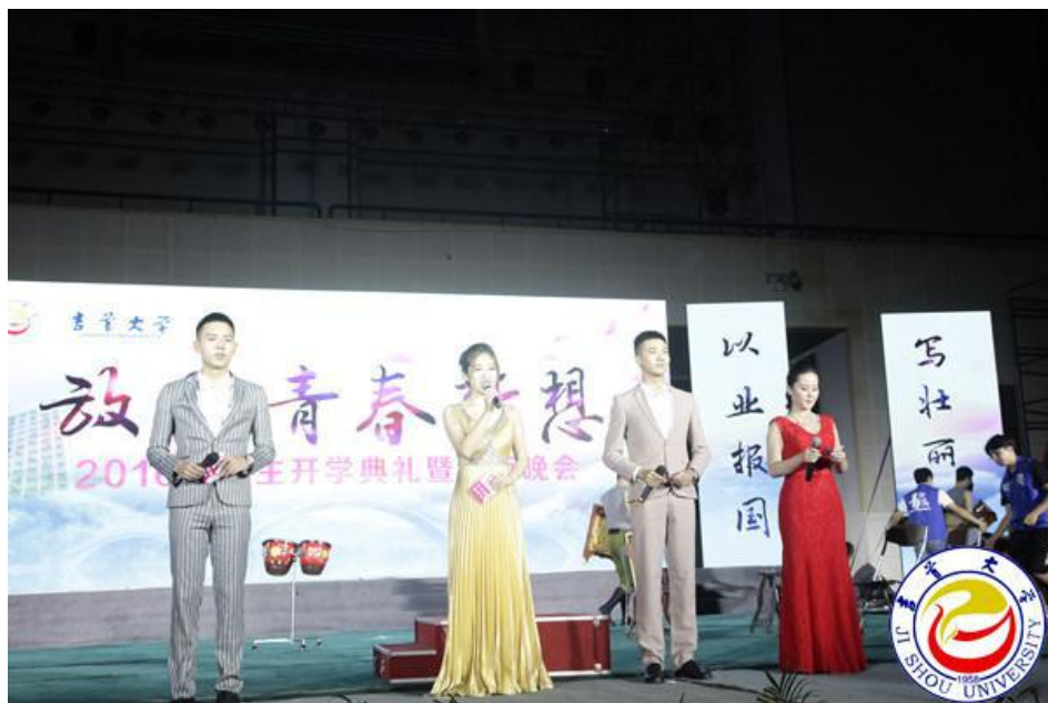
图为开学典礼暨迎新晚会主持人