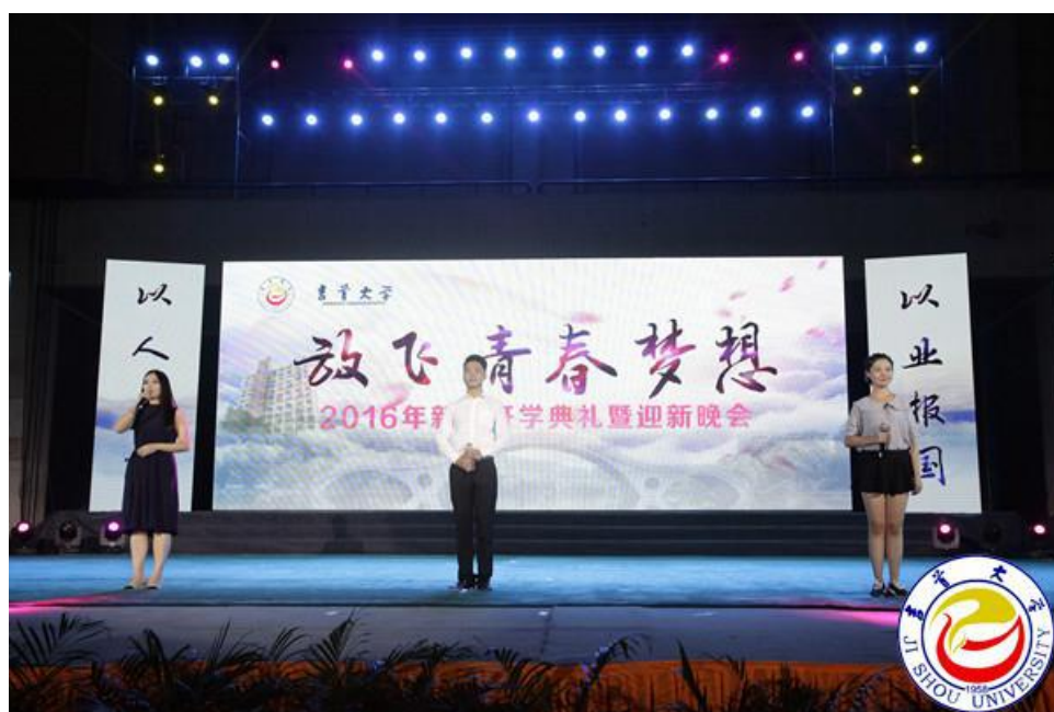
图为老生代表发言