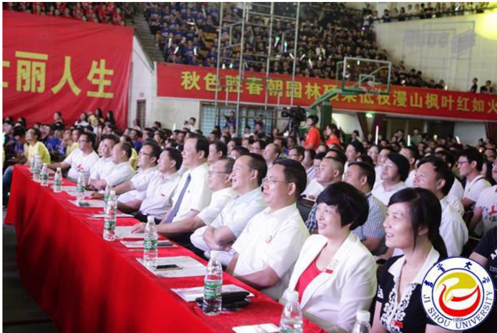
图为校领导及教师代表观看晚会

典礼开始前，校电视台精心制作的暖场视频《吉大因你而骄傲》让现场师生感受了湘西的神秘与美丽，更感受了感受着学校 58 年来的沧桑巨变和飞速发展。当看到前国务院总理朱镕基站在风雨湖玉虹桥上喊出“吉首大学是湖南的骄傲”的画面时，全场掌声雷动，经久不息。晚会进入倒计时。