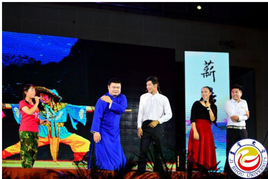
图为新老生同台表演群口相声《多彩校园 美丽吉大》