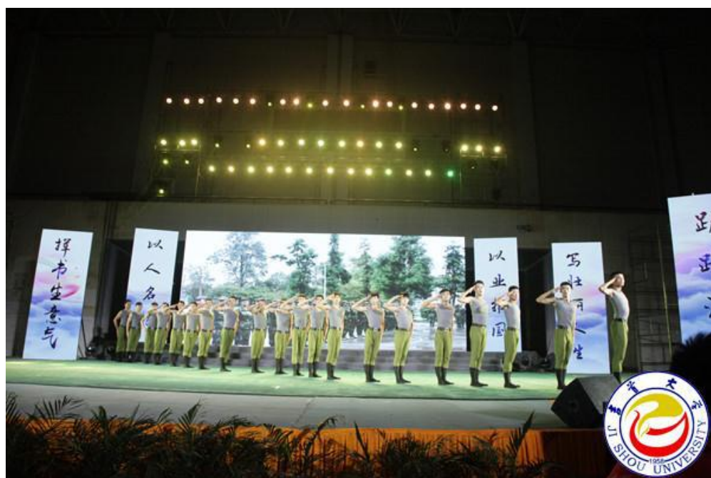
图为群舞《步调一致》表演